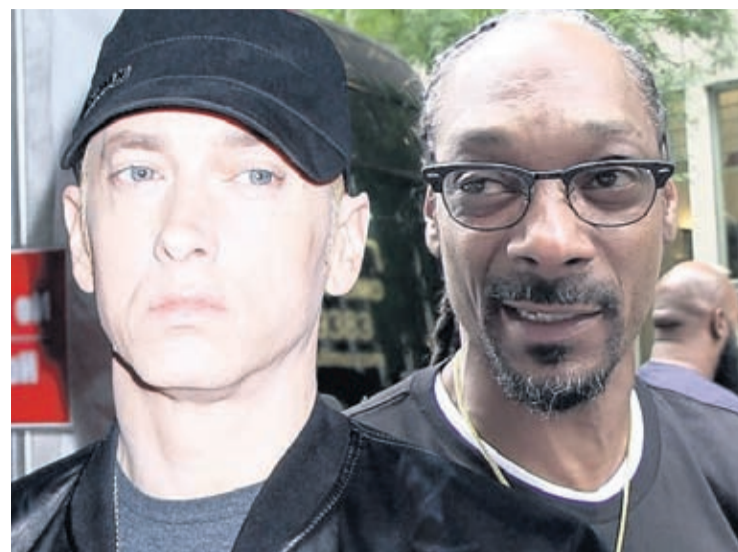
parte" Tal ves mi lo a bisa mescos na

E ta rap tambe tocante Zeus, "Pero, ami semper y cuando mi bolbe promete di ta honesto y di curason, disculpa mi Rihanna. Door di e cancion ey cu a filtra, mi ta disculpa Ri. E no tabata destina pa causa bo dolor. Di tur modo, e tabata malo den mi